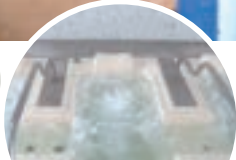
採暖槽(リラックス)

自分のペースで泳いだり、歩いたりはもちろんのこと、ウォーキングやレベルに応じた泳ぎ方の指導を行う20分～30分程度の無料プログラムを実施しています。