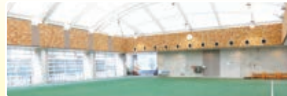
【いきいきグラウンド(別棟)】

砂入り人工芝のアリーナ(19m×23.3m)を備え、グラウンドゴルフ、ゲートボール、パタンクなどニュースポーツ普及の拠点施設として、高齢者の健康づくりを支援します。