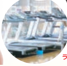
ランニングマシン